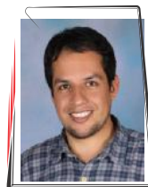
H. Leandro Vallejo 1983 Medellín

San Fabián, papa y mártir San Sebastián, mártir DÍA PENITENCIAL QUINTO DÍA DE LA NOVENA VOCACIONAL